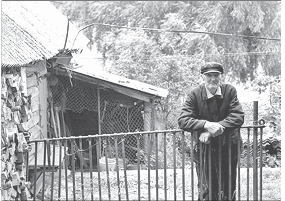
У дэпрэсіўнай вёсцы застаюцца адны старыя.

гэта юрыдычна замацуем». Таксама было заяўлена, што «малады спэцыяліст,