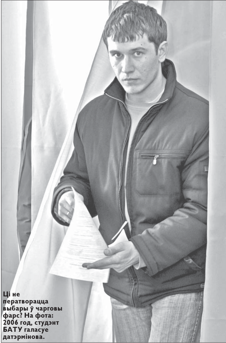
Ці не ператворацца выбары ў чарговы фарс? На фота: 2006 год, студэнт БАТУ галасуе датэрмінова.

Старшыня Цэнтральнай рэвізійнай камісіі БСДП (НГ) Мікалай Кійка кажа, што на стан 28 ліпеня былі зарэгістраваныя 63 прадстаўнікі «Эўрапейскай кааліцыі».