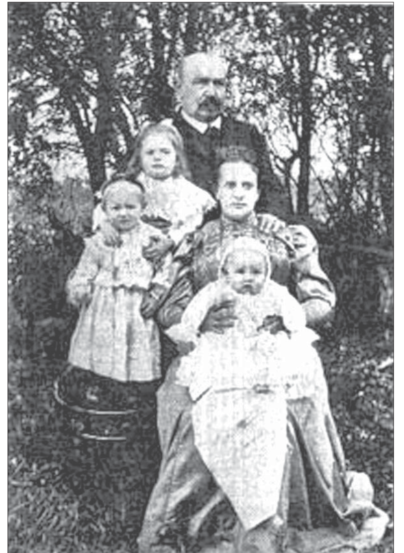
Станіслаў Нарбут зь сям'ёй.

Калі адбылося ўзьяднаньне Заходняй і Ўсходняй Беларусі, новыя ўлады вырашылі скасаваць імя Нарбута з назвы браслаўскай вуліцы. Зьбіраліся нават зьнесці помнік яму, бо ён сам быў «панам». Аднак, як кажуць, рукі не дайшлі. Затое пасьпелі «пашчыраваць» вандалы. У выніку памятная дошка «ад жыхароў Браслаўскага павету» зьнікла, зьнік і ліхтар, які ўпрыгожваў абэліск. Так і стаяў абэліск некалькі дзесяцігодзьдзяў зьявечаным. У паваенны час на ім прымацавалі іншую дошку, якая сьведчыла, што