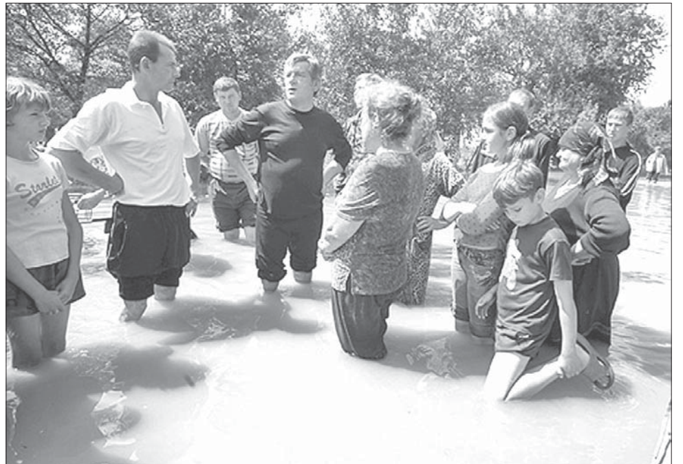
Паводка ў Прыкарпацці і Прыднястроўі. Прэзыдэнт Украіны наведвае затопленыя раёны.