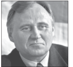
Мікола Статкевіч («Эўракааліцыя»)