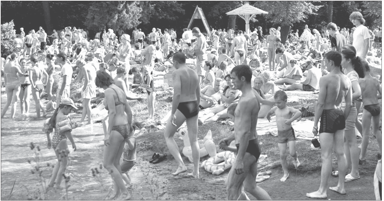
Беларусы аддаюць перавагу простым таварам і таннаму адпачынку, але нарошчваюць грашовыя ашчаджэньні. На фота: пляж на Сьвіцязі.

У адрозьненне ад мінулага году сёлета беларусы валюты больш прадаюць, чым набываюць. Адна часова значаная частка валюты вывозіцца банкамі з краіны. Пры гэтым даляраў ЗША вывозіцца больш, а завозіцца ў асноўным эўра, што дае падставы казаць пра выцягненьне эўрапейскай валюты амэрыканскай.