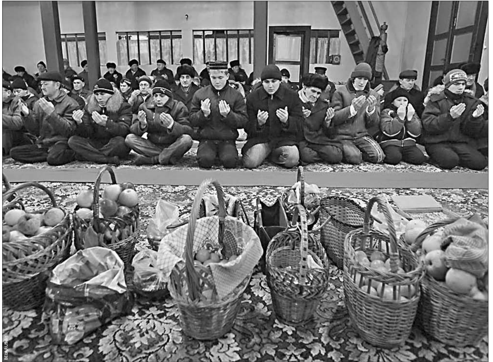
16 лістапада мусульмане пачалі святкаванне Курбан-Байрама. У беларускіх мусульман гэтае найбольшае свята ў сваіх праявах нагадвае хрысціянскі Вялікдзень. На фота: у мячэці Іўя.