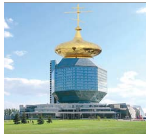
У інтэрнэце з'явіліся сатырычныя калажы з нагоды «ацыбульвання» царквы ў Наваградку.