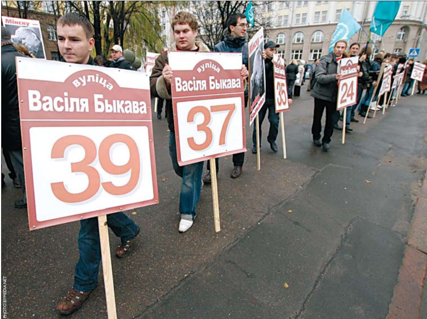
Кампанія «Гавары праўду» 9 лістапада правяла перформанс з патрабаваннем перайменавання адной са сталічных магістраляў у вуліцу Быкава.