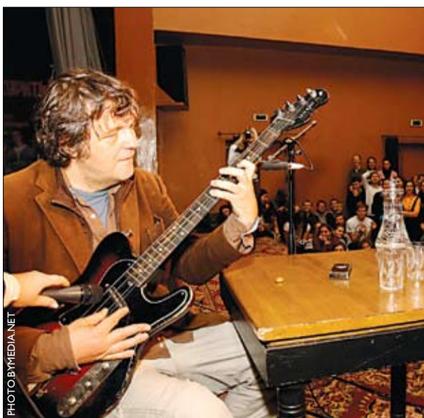
Рэжысёр Эмір Кустурца хоча жыць пры салодкай дыктатуры. Старонка 11.