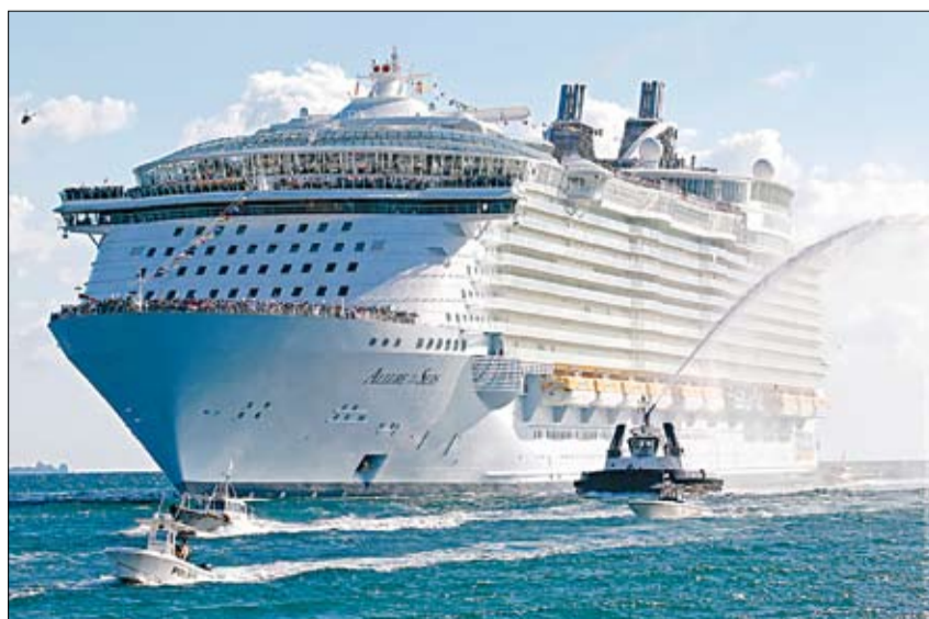
Палепшаны «Тытанік»? Allure of the Seas — адзін з двух самых вялікіх круізных лайнераў у свеце — пераплыў Атлантыку. Гіганцкі карабель разлічаны на 6318 пасажыраў і 2000 членаў экіпажу.